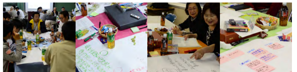
新しい会設立提案後・分科会の様子：期待とちょっぴりの不安を胸にたくさんの夢や要望が語られました。