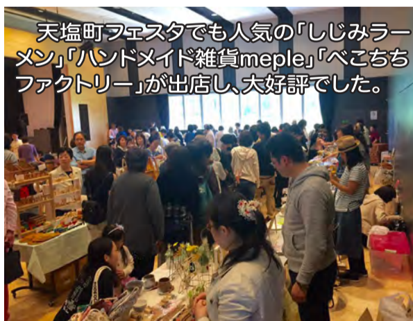
天塩町フェスタでも人気の「しじみラーメン」「ハンドメイド雑貨meple」「べこちちファクトリー」が出店し、大好評でした。