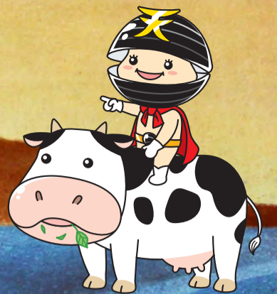
題字背景・パステル画:sakko