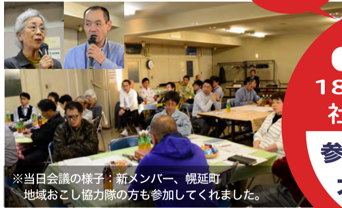
※当日会議の様子：新メンバー、幌延町地域おこし協力隊の方も参加してくれました。