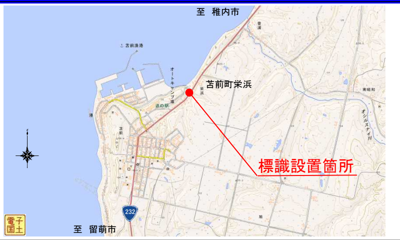
標識設置イメージ