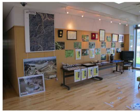
ダム管理支所 展示室(1階ロビー)