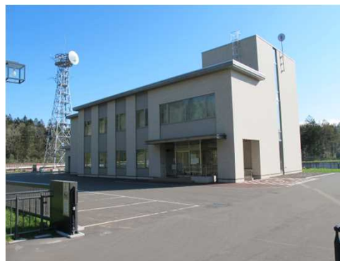
ダム管理支所 管理棟