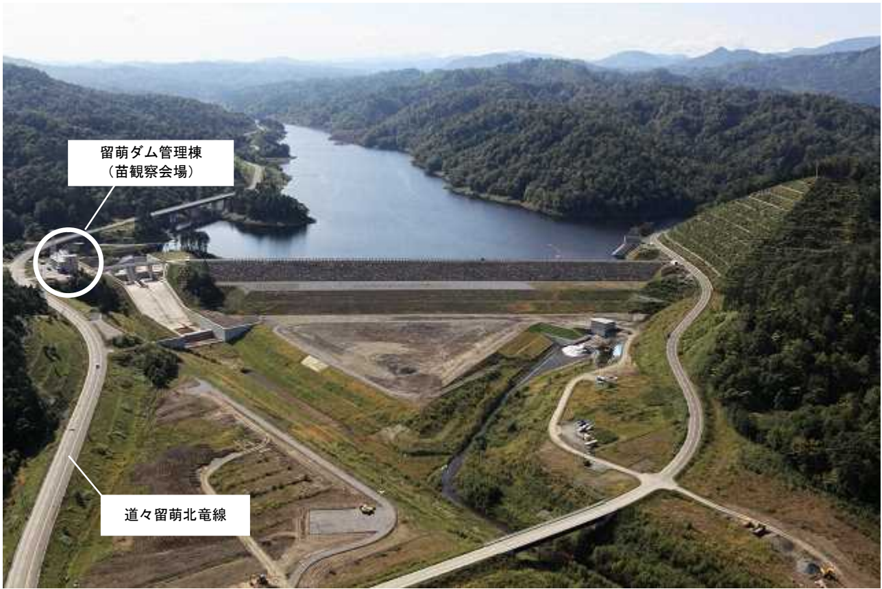
苗観察会場周辺の状況写真