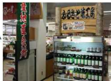
販売コーナーの様子