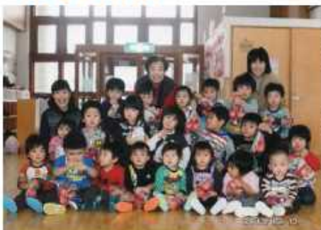
保育園訪問の様子

地元産の野菜や果物を活かし、福神漬け「かあちゃん漬け」や、特産の果物を使ったジャムや、りんご・梨のコンポートを手作りで行っています。