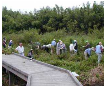
ビオトープの整備