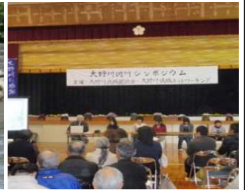
シンポジウムの開催