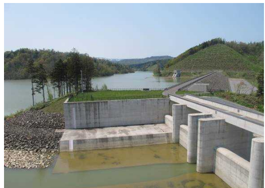
管理支所からダム湖を望む