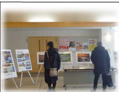
2月9日～18日 稚内市立図書館