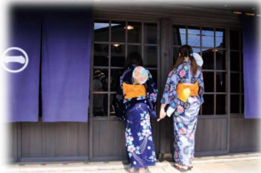
2017年グランプリ作品 【涼風】