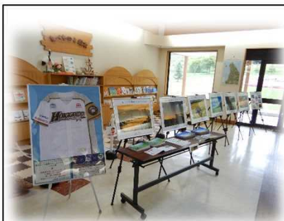
9月8日～9月28日 道の駅「絵本の里けんぶち」