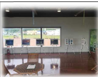
7月1日～9月7日 道の駅「るもい」