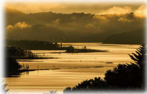
2018年グランプリ作品 【朱鞠内湖の朝】