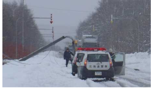
暴風雪による電柱の倒壊（国道336号 大樹町）