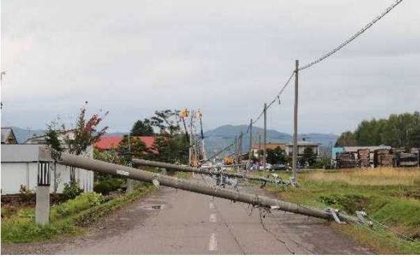
突風・飛来物による電柱の倒壊（東川町 町道）