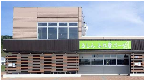
船場公園（るしんふれ愛パーク）