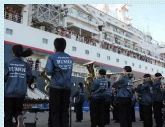
学生によるマーケティング演奏