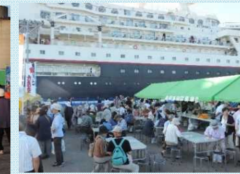
クルーズ船寄港時の様子