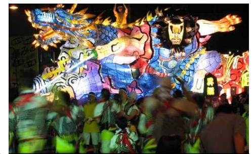
るもい呑涛まつり