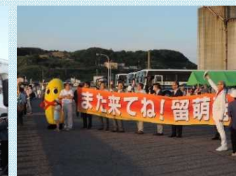
市民によるお見送り