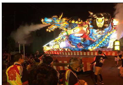
るもい呑涛まつり