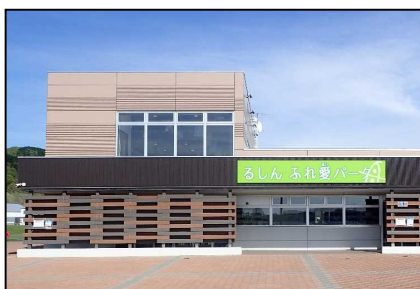
船場公園（るしんふれ愛パーク）