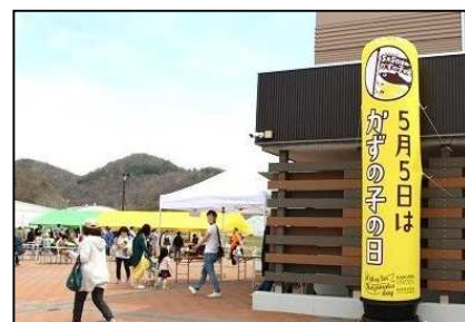
『かずの子のマチ留萌』フェスタ

【問合せ先】 国土交通省 北海道開発局 留萌開発建設部（電話 0164-42-4816）