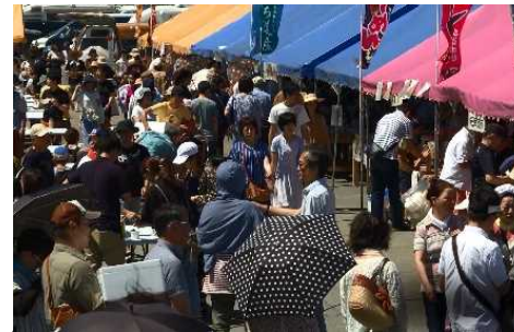
うまいよ！るもい市