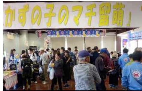
「かずの子のマチ留萌」フェスタ