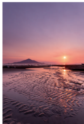
2015年グランプリ作品 【夕日に染まる砂紋】

フォトコンテスト受賞作品は写真パネルにして道の駅や観光拠点での展示を行っています。