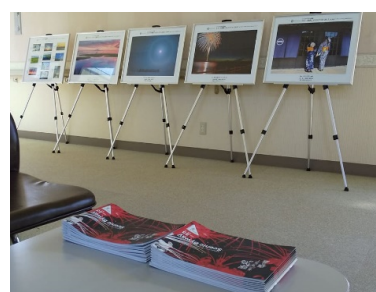
8月13日～21日 初山別岬センター