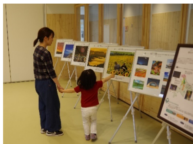
6月15日～23日 道の駅 「北オホーツクはまとんべつ」