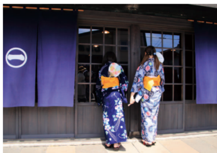
2017年グランプリ作品 【涼風】