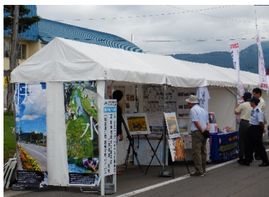
8月31日 幌加内新そば祭り