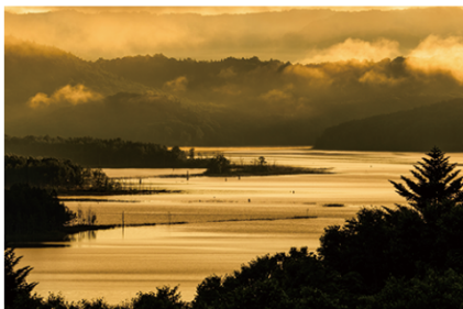
2018年グランプリ作品 【朱鞠内湖の朝】