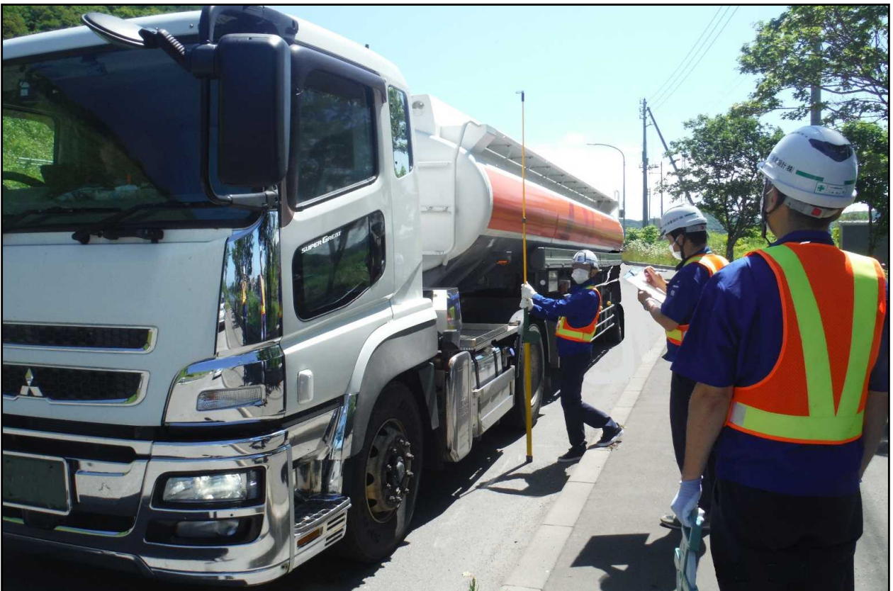
車両諸元(高さ)の計測