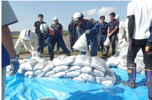
積み土のう工の実施状況