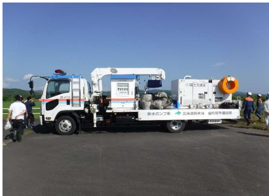
排水ポンプ車の説明