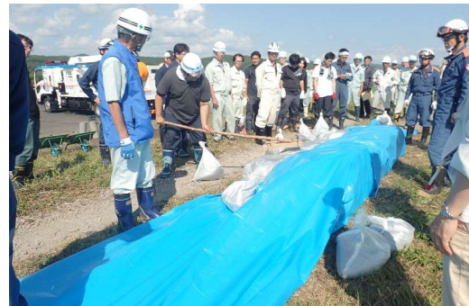
積み土のう工の実施状況