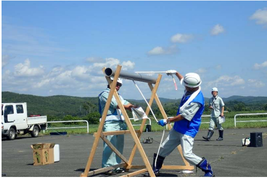
ロープの結び方の受講状況