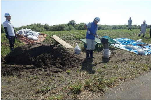
土のうの作り方の受講状況