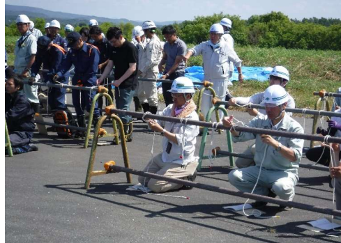
ロープの結び方の受講状況