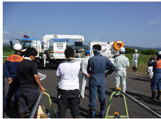
排水ポンプ車の説明