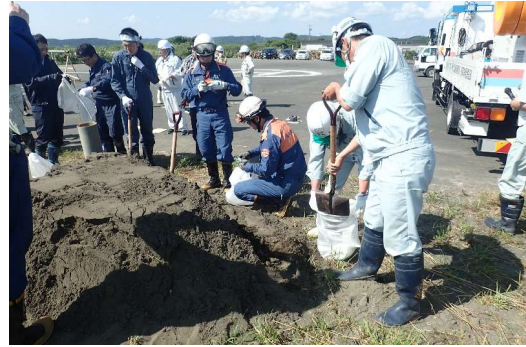
土のうの作り方の受講状況