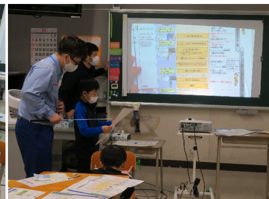
作成したマイ・タイムラインの発表