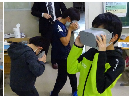
天塩川のVR映像の体験