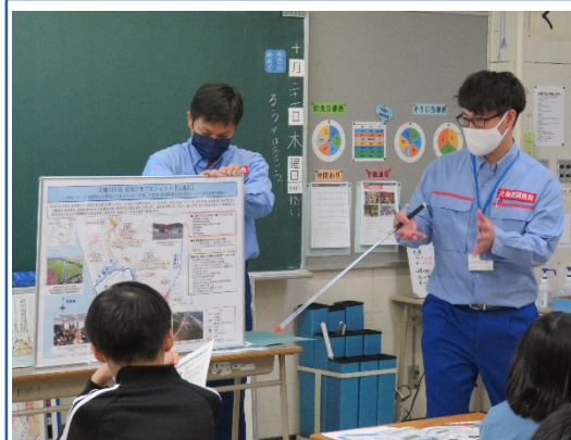
天塩川の水害を防ぐための対策の説明 (天塩川下流域治水プロジェクト)