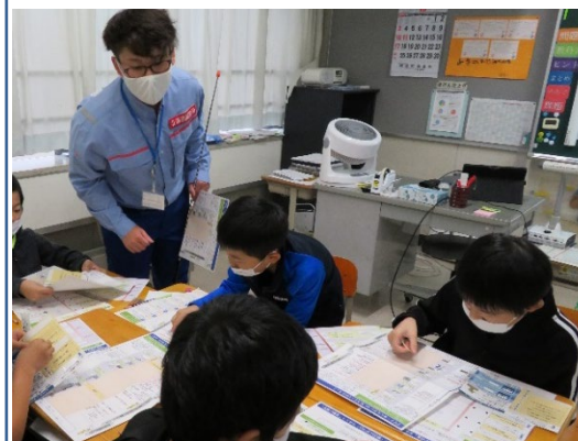
マイ・タイムラインの作成