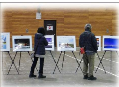
2022年3月1日 道の駅「あさひかわ」