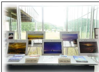
2021年8月16日～27日 豊富町「ふらっと★きた」