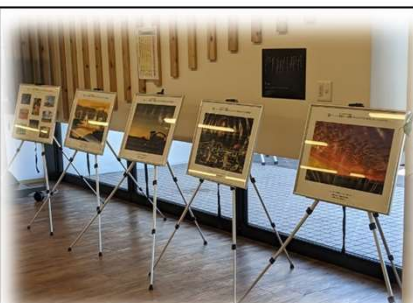
2021年9月1日～10月1日 道の駅「えんべつ富士見」