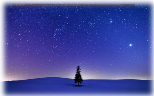
2020年グランプリ作品 【星空のステージ】