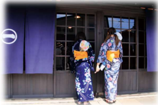
2017年グランプリ作品 【涼風】