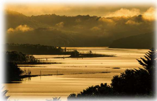
2018年グランプリ作品 【朱鞠内湖の朝】