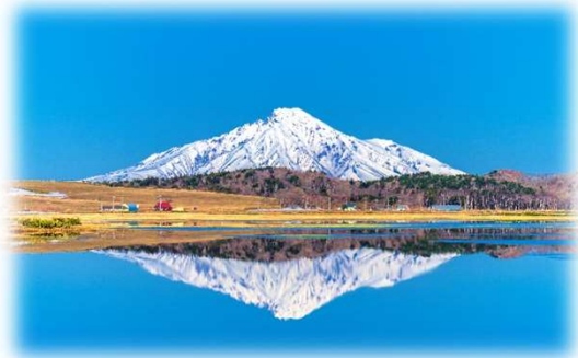
2021年グランプリ作品 【早春の逆さ富士】

フォトコンテスト受賞作品は写真パネルにして道の駅や観光拠点での展示を行っています。