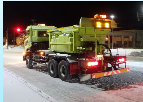
<凍結防止剤散布車>

凍結防止剤散布車により、交差点部などのツルツル路面において凍結防止剤（塩化ナトリウム等）や防滑材を散布します。