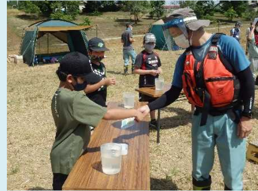
透視度計やパックテストを用いた簡易水質検査の説明