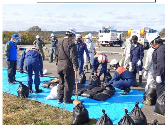
積み土のう工の実施状況