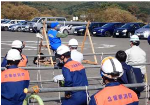
ロープの結び方の受講