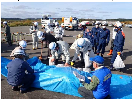
積み土のう工の実施状況