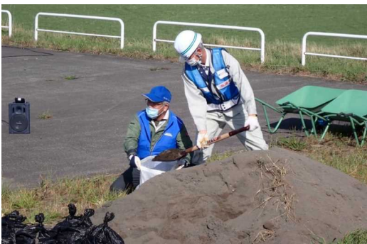
土のうの作り方を学び、土のう製作