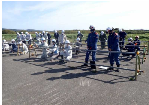
ロープの結び方の受講