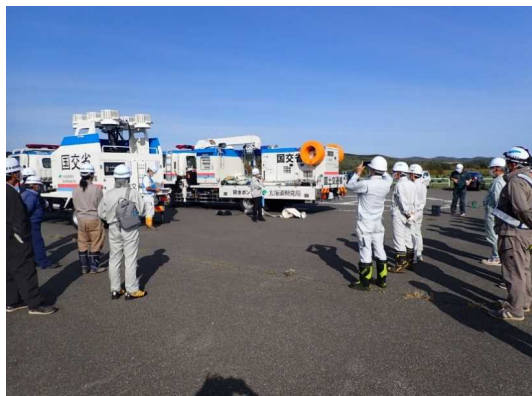
排水ポンプ車・照明車の説明