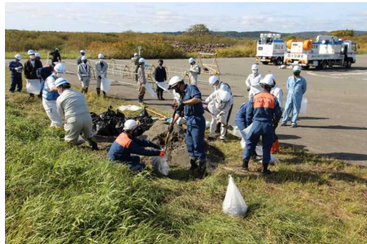
土のうの作り方を学び、土のう製作