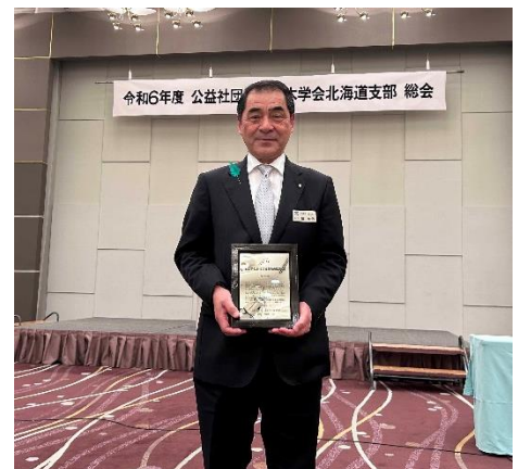
賞状後の記念撮影