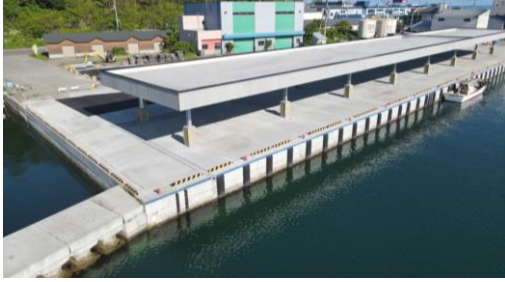
屋根付き岸壁全景

平成29年度に国土交通省港湾局長に認定された北海道の6港湾による「農水産物輸出促進計画」に基づき、増毛港において、鳥糞や直射日光等を防ぎ、水産物の鮮度や品質低下等を防止するための屋根付き岸壁の整備に着手し、令和3年7月に供用を開始。