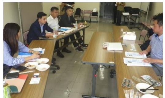
海外バイヤーとの商談会