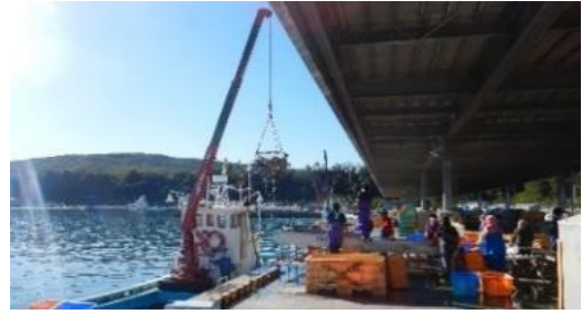
屋根付き岸壁下での水揚げ状況