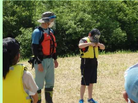
パネルを用いた危険箇所やライフジャケットの説明