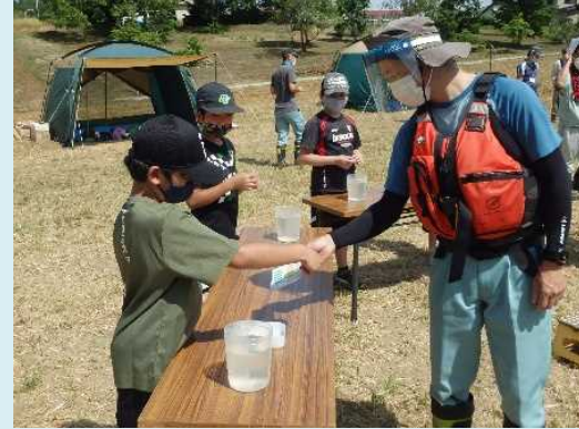
透視度計やパックテストを用いた簡易水質検査の説明