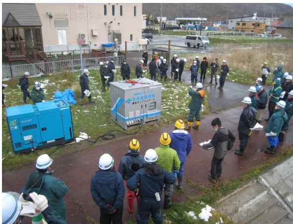
排水ポンプパッケージの紹介