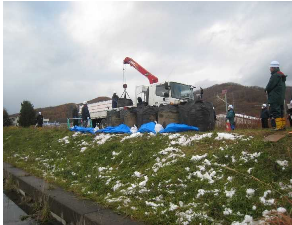
大型土のう工法実施状況