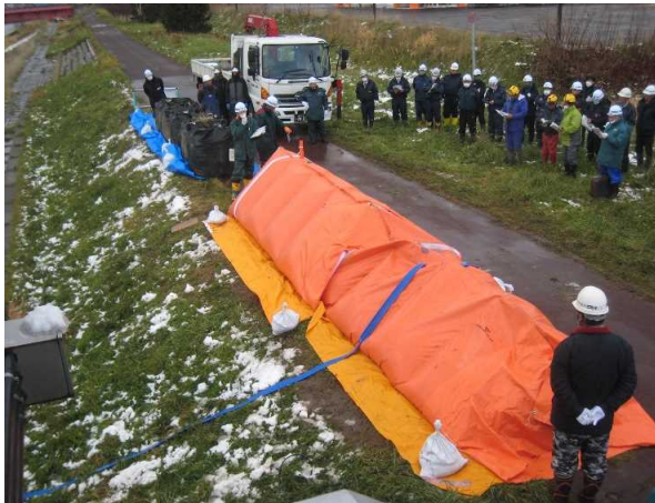
水マット工法の実施状況