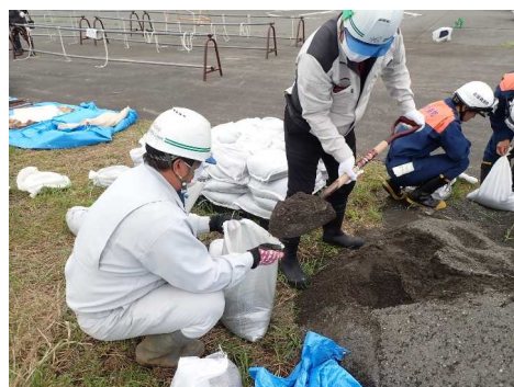
土のうの作り方を学び、土のう製作