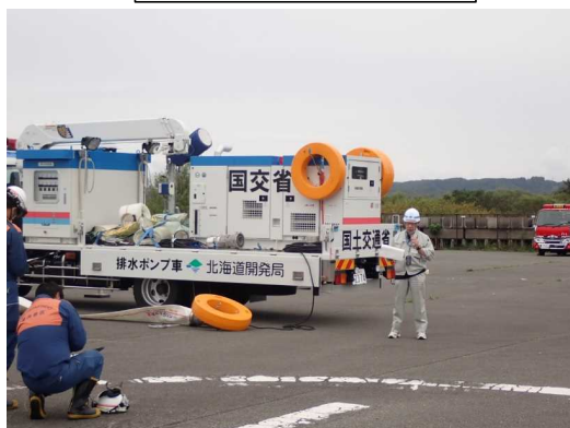
排水ポンプ車の説明