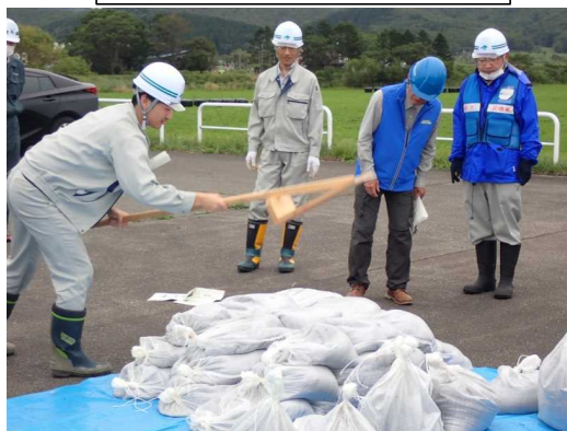
積み土のう工の実施状況