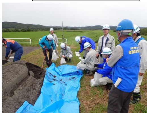
積み土のう工の実施状況