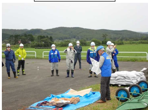
土のうの作り方を学び、土のう製作