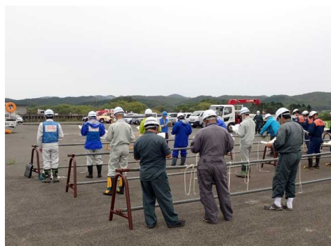
ロープの結び方の受講