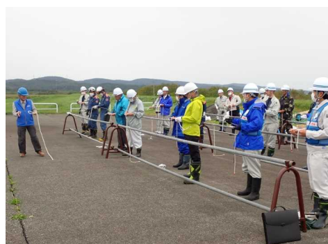
ロープの結び方の受講