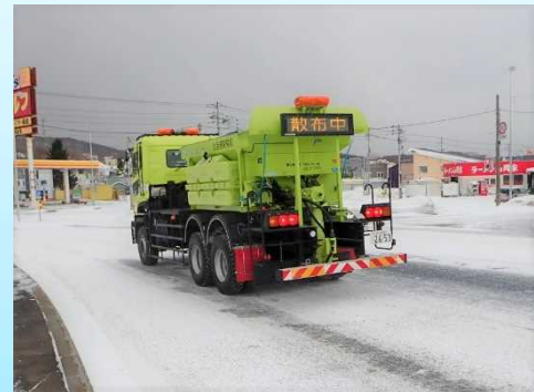
<凍結防止剤散布車>

凍結防止剤散布車により、交差点部などのツルツル路面において凍結防止剤（塩化ナトリウム等）や防滑材を散布します。