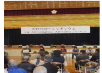
シンポジウムの開催