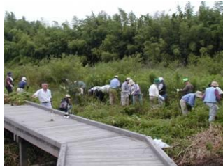
ビオトープの整備