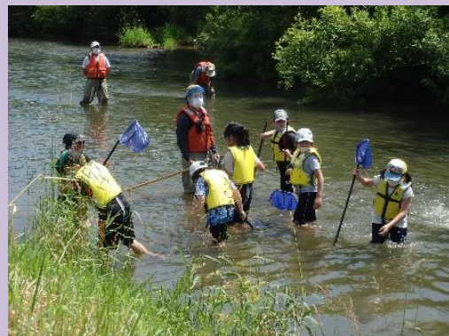
留萌川の魚類観察と水生生物調査