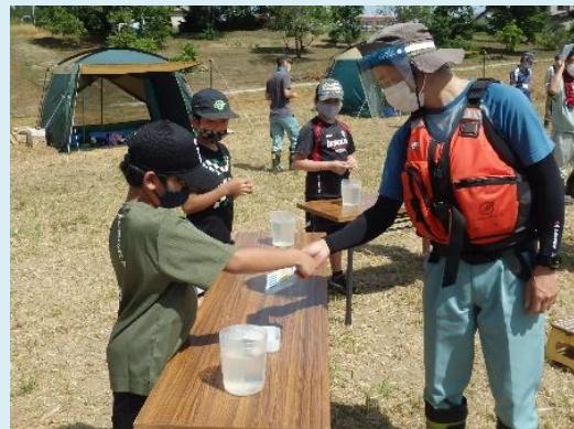
透視度計やパックテストを用いた簡易水質調査