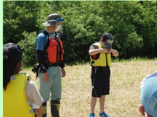
パネルを用いた危険箇所やライフジャケットの説明