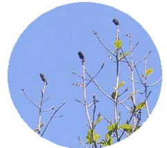
ホウの木の種を発見！！ 枝の先になるんですね・・・