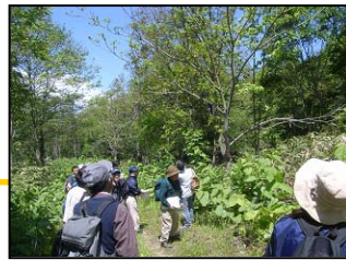
皆さん木の上を見ていますが、何か見つけたのでしょうか？