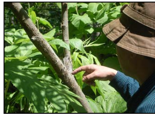
何かを見つけて説明しています！（蜘蛛の巣・・・）