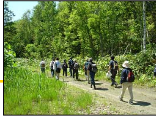
いざ出発！ 天気良くて気持ちいいね！ 何か見つけれられるかな？