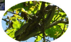
へびまで見つけてしまいました！！