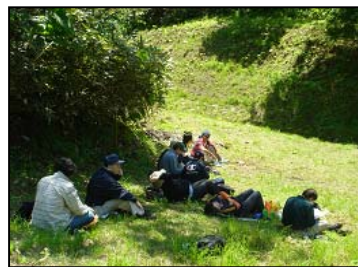
天気良かったので、お弁当は途中の広場で！（＾＾）！