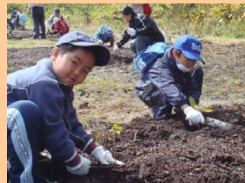
僕が植えているのはオニグルミ！！