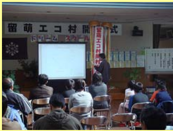
留萌川洪水の歴史と留萌ダム についても学びました。