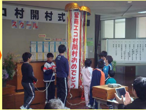
幌糠小学校児童のくす玉割。 見事に割れました！！