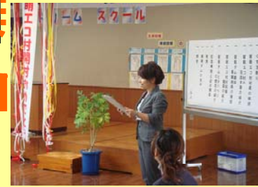
村山教育委員長よりエコ村の 憲章を朗読。