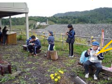
おまちとおさまです！！ 本日のお昼ご飯は鮭とキノコの炊き込みご飯です