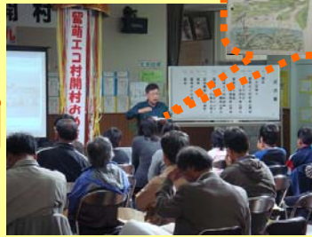
飛渡環境課長より千バベリの歴史 や自然のお話がありました。