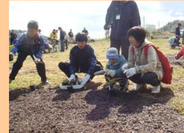
どの木にしようかな・・・？