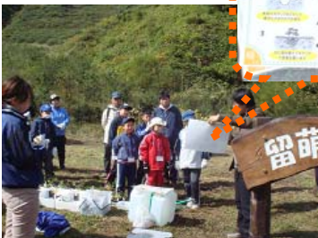
植え方の説明を聞き、みんなで記念植樹！ 1つの円の中に10種類の木を植えるんだね！