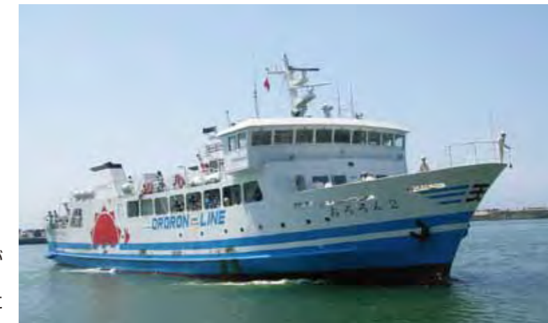
離島航路連絡船「フェリーおろろん2」