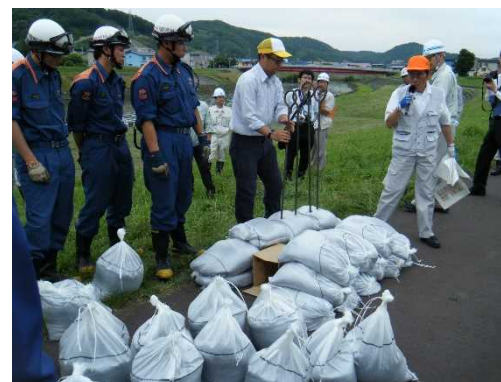
積み土のう工の講習