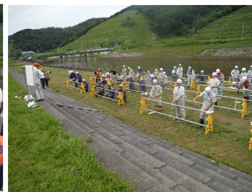
縄の結び方の講習