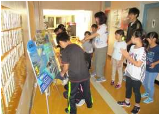
学習の様子(潮静小学校)