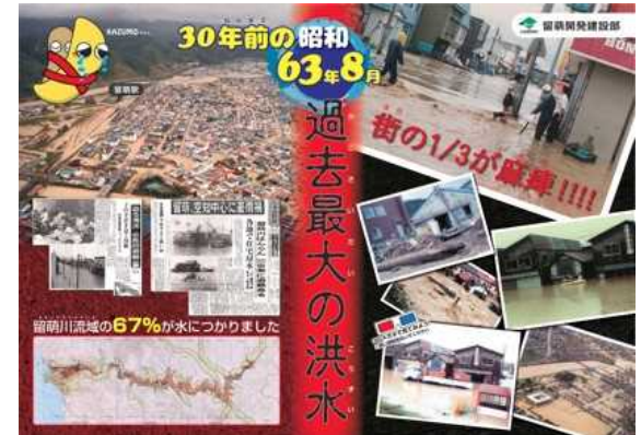
留萌川洪水の説明用パネル