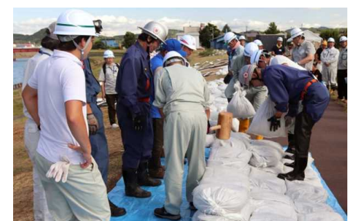
積土のう工法実習