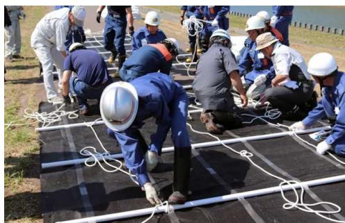
シート張り工法実習

留萌開発建設部に配備されている排水ポンプ車の説明を行うとともに、排水作業の実演を行った。