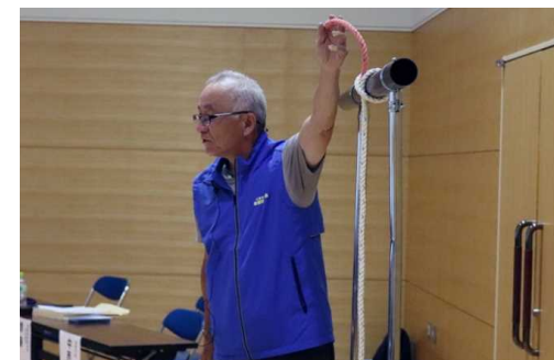
水防専門家による指導状況