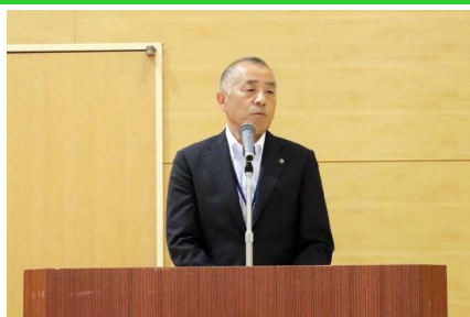
中西留萌市長による開催地代表挨拶