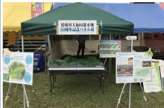
大和田遊水地模型の展示