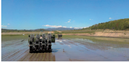
スマート農業（自動操舵田植え機）

北海道総合開発計画に基づき、「農林水産業・食関連産業」を戦略的産業として育成していくため、農業用排水施設の整備やほ場の大区画化などの農業生産基盤の整備を行っています。