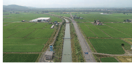
幹線用水路沿いに広がる水田