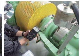
機能診断(排水機ポンプ設備)