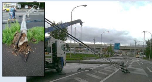
【台風の影響で電柱が倒壊(札幌市、国道275号)】

一般国道12号(札幌市) の事例より 上段:無電柱化 整備前 下段:無電柱化 整備後