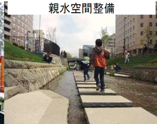
創成川通沿道の空間形成イメージ