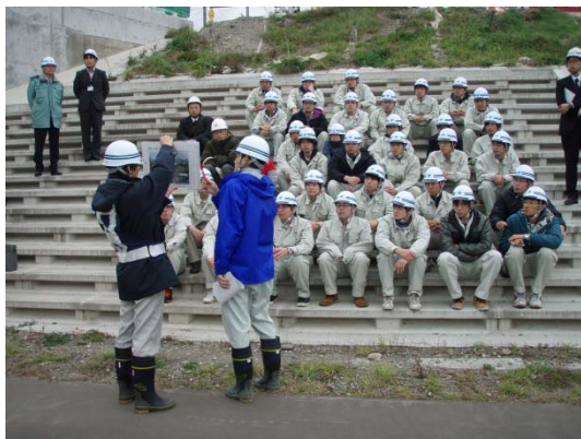
工事に関する説明