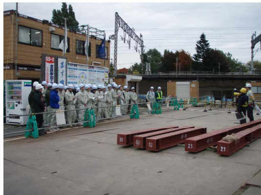
工事に関する説明