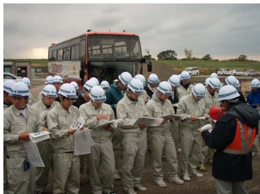
工事に関する説明