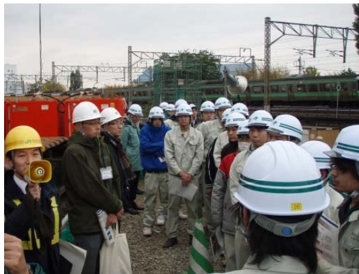
工事に関する説明