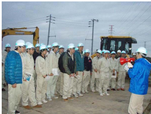
工事に関する説明