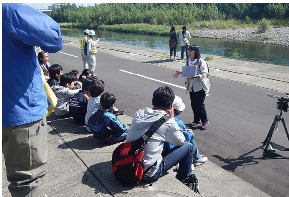
専門家による鳥の生態説明