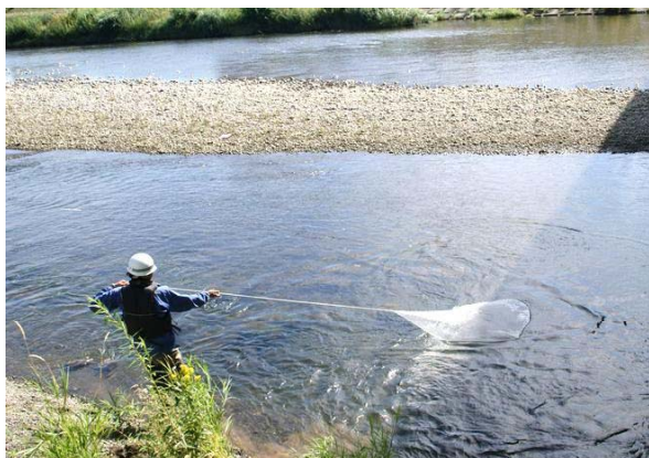
投網による採捕状況