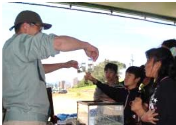
専門家による魚の生態説明