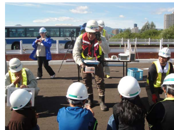
環境保全に関する説明