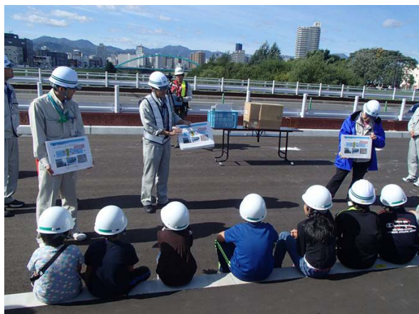
工事に関する説明