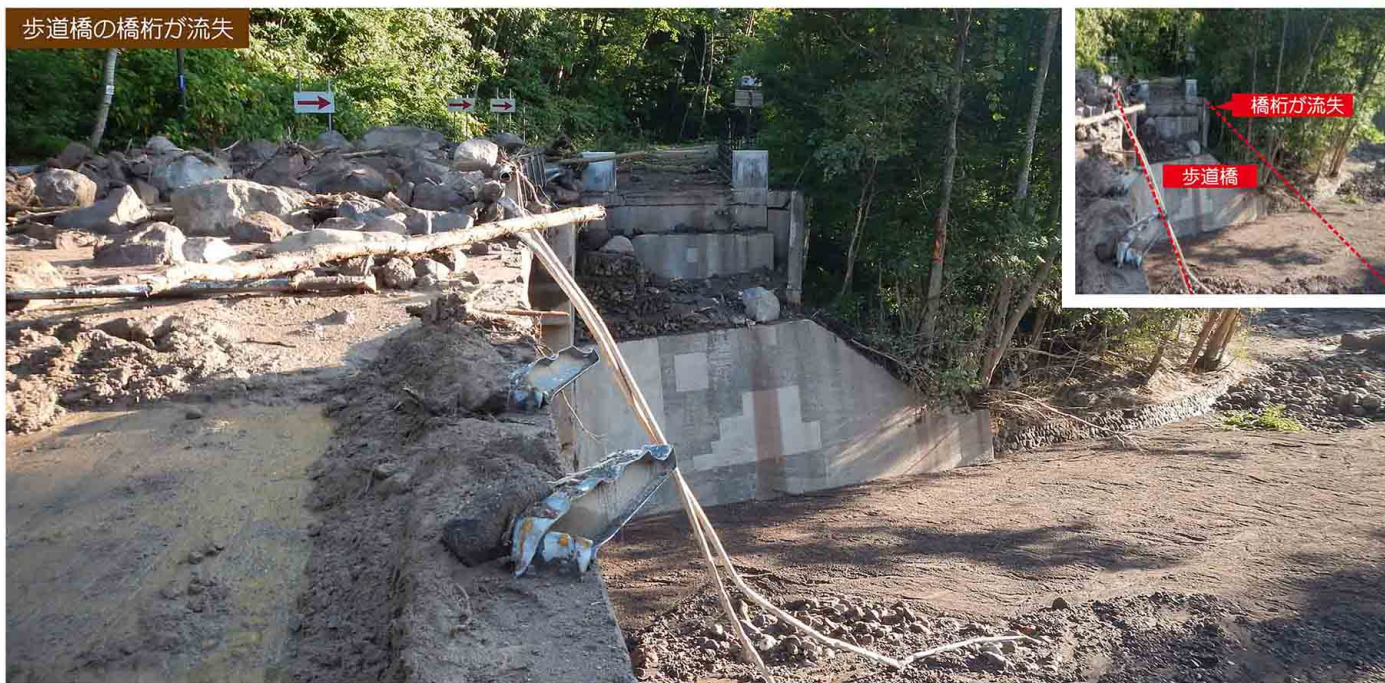
歩道橋の橋桁が流失