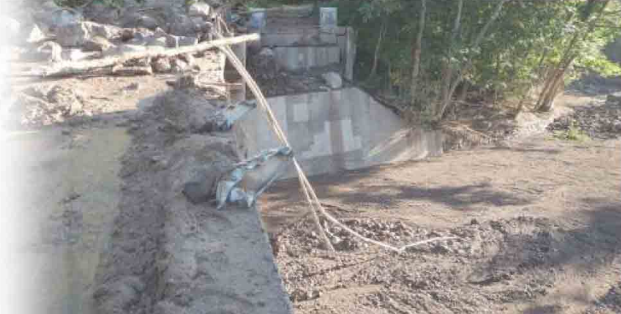
【札幌開発建設部管内における国道の通行止め状況】