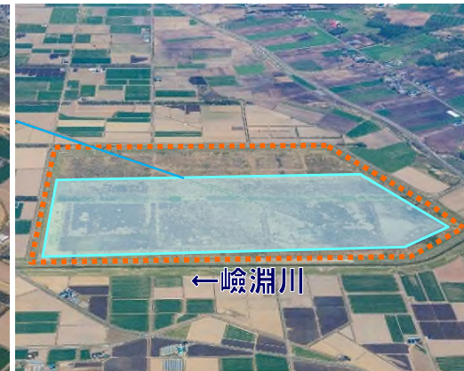
舞鶴遊水地 (長沼町)