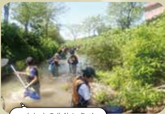
由仁中の生物しらべ