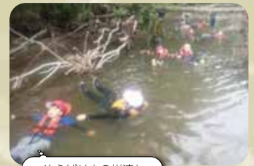
ゆうばり小の川流れ