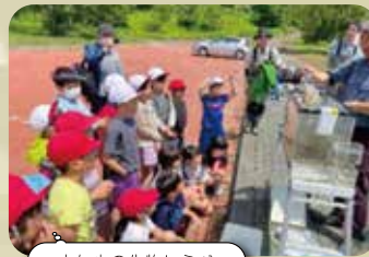
由仁小の生物しらべ