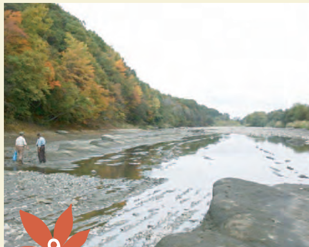
9 イタイベツ川合流部付近