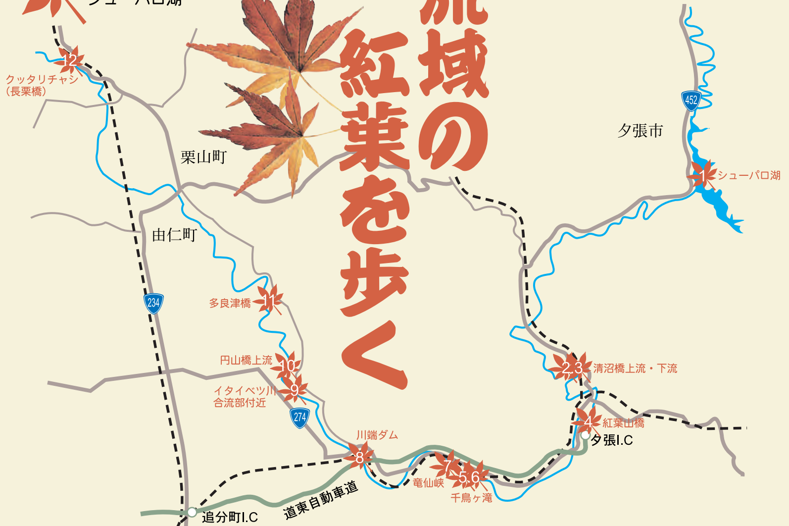
12 クッタリチャシ (長栗橋)