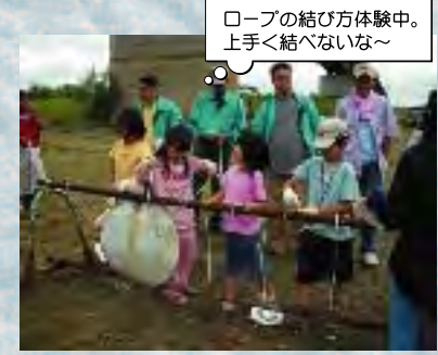
ロープの結び方体験中。上手く結べないな~