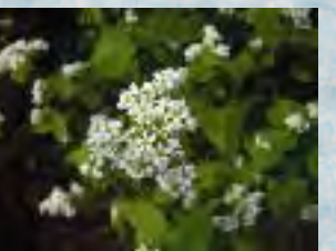
近くで見ると、蕎麦の花はとても可憐です。