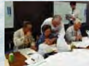
流域の住民も参加しています。