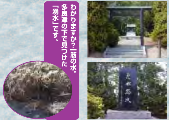
わかりますか？「筋の水。多良津の下で見つけた「湧水」です。