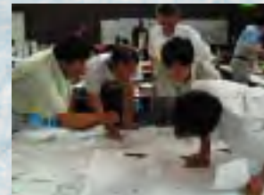
地図上で対策を検討します