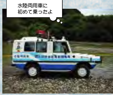
水陸両用車に初めて乗ったよ