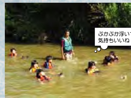
ぶかぶか浮いて気持ちいいね！