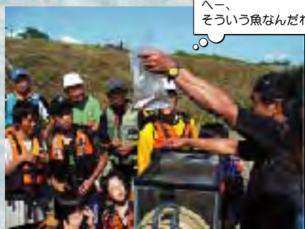
へー、そういう魚なんだね