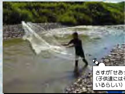
さすが「せあっち!!!」(子供達にはそう呼ばれているらしい)