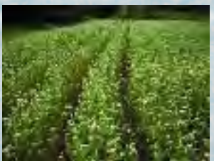
畑には「うね」を作ったので、草取りや収穫が楽になるそうです。