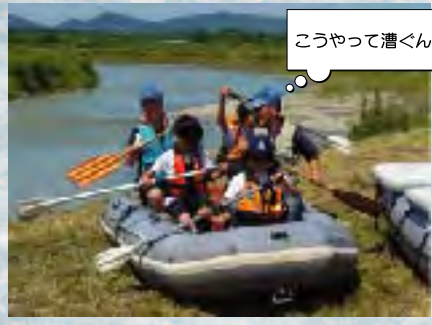
こうやって漕ぐんだよ

「夕張川なんでも探検隊」の主催で地域の子供達の参加を募り、昨年に引き続き『夕張川塾』が開催されました。川塾の最初はボートで川下り。子供達は鳥や魚を探していましたが、さすがに魚は見つけられな。途中の難所も順調に下りましたが、中には「子