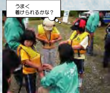
うまく着けられるかな?