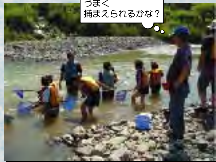
うまく捕まえられるかな？