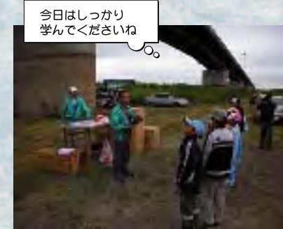
今日はしっかり学んでくださいね

子どもの水防団 水防訓練 開催日/平成18年7月23日(日) 場所/夕張川左岸(長栗橋直下) 集中豪雨等により、全国のどこかで、毎年洪水被害が繰り返されています。また、夕張川流域は、むかし洪水に苦しめられ、その脅威は今も消えていません。このような状況を背景に、「リバーネット21なごま」の主催で、子供11名、大人24名が参加して『子ども水防団 水防訓練』が開催されました。 訓練の内容は、川歩き(避難)体験、流れに流される体験、水陸両用車試乗体験、土のう作り・土のう積み体験、ロープ結び体験と盛りだくさんの内容です。水害発生時には様々な危険や普段と違う状況により、避難も困難になることが考えられます。子供達は水中を歩く難しさや、歩みにくさを体感したり、水防活動とはどんなものか、活動の一部を体験しました。 「遊びながら、学んでほしい」との主催者の意向通り、子供達の歓声や笑い声が絶えませんでした。その中でも時折真剣な表情が見られ、子供達は確かに何かを感じ取っていたようです。