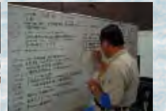
次々と書き込まれる情報