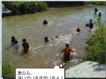
あらら、泳いでいる子がいるよ！