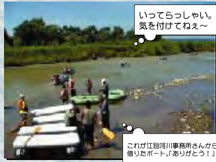
いってらっしゃい。気を付けてねえ〜