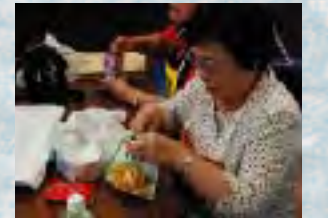
避難先での食事も試食しました。