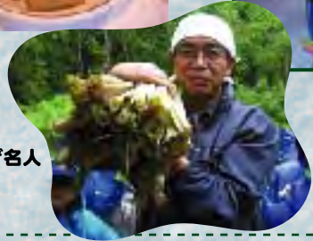
探検が終わったら自然について勉強です。