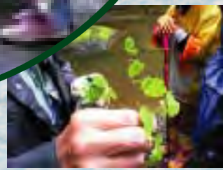
見たことのない野草