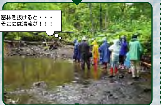
密林を抜けると...そこには清流が!!!!