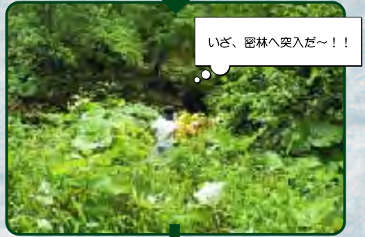
いざ、密林へ突入だ~!!