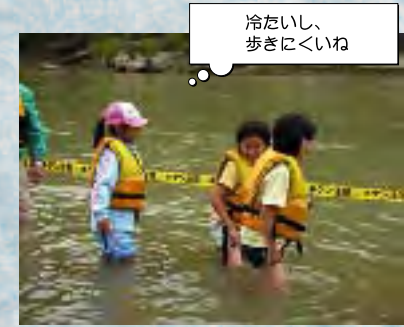
冷たいし、歩きにくいね