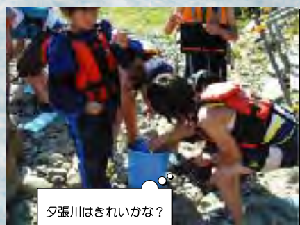
夕張川はきれいかな？

て、川が「川ガキ」でいっぱい。岩見沢河川事務所の協力で、パックテストによる水質検査とライフジャケットを使つての川遊びが行われました。川を流れて子供達は大喜び、時間いっぱいまで遊んでい