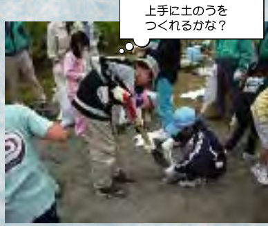
上手に土のうをつくれるかな?