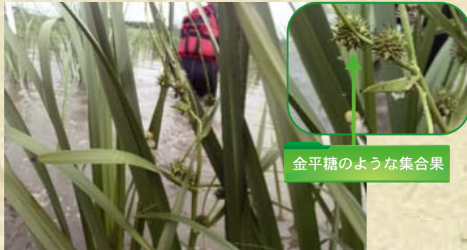
金平糖のような集合果