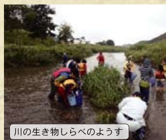
川の生き物しらべのようす