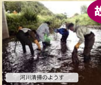
河川清掃のようす