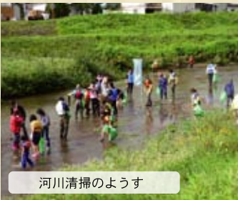
河川清掃のようす