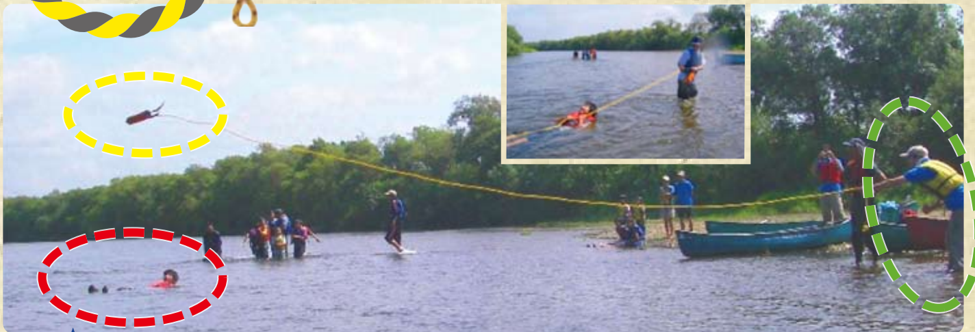
レスキューロープを使った救助の様子

レスキューロープ(スローロープ)は、浮力体が内蔵されたバッグに長さ10m〜25mの水に浮くロープが収納されたもので、陸上から要救助者を救うためのものです(カヌー、ボートの牽引に使用できるタイプもある)。救助者がこのロープを投げることで、要救助者に近寄る危険や水に入る危険を極力低くして、要救助者を救助できます。 シンプルな救助方法ですが、ロープの投げ方や引き寄せ方は、訓練が必要です。ロープに絡まる等で2次災害が起きることもあるので専門家の指導を受けることが大切です。