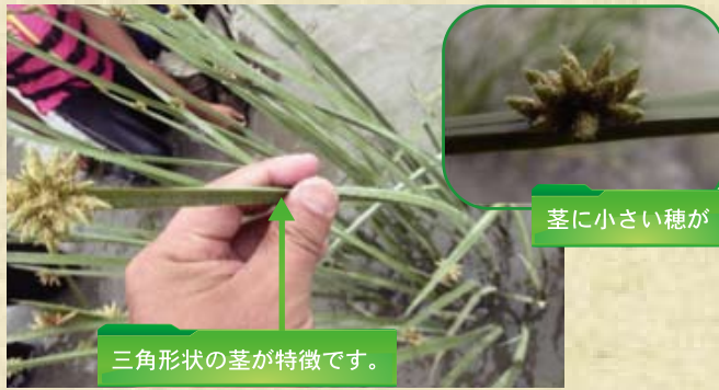
三角形の茎が特徴です。