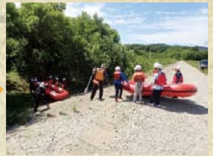
きれいに再整備 写真：由仁小学校のボート体験