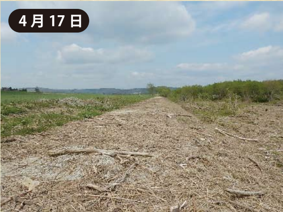
土砂流木が大量に残る長沼頭首工下流左岸

3月の洪水は、川岸に残る雪水を巻き込みながら大量の土砂と流木を夕張川下流へ押し流しました。写真左の長沼頭首工下流左岸にも大量の流木と土砂が流れこみ、水辺のアクセス道（砂利道）が埋まってしまいました。河川管理者と地元NPO等利用者が現地視察を行い、役割を分担して再整備をすることになりました。元通りになった当該地では、川下りや川流れ、ボート体験等の活動が例年通りに行われるようになりました。