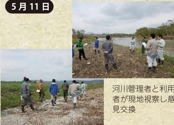
河川管理者と利用者が現地視察し意見交換