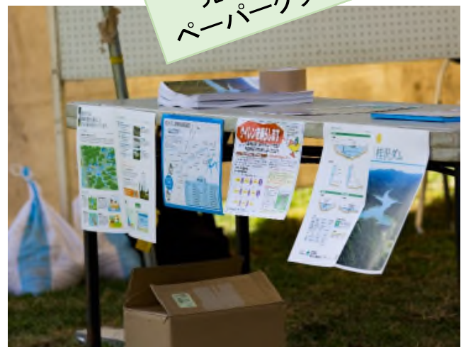
桂沢ダム紹介コーナー