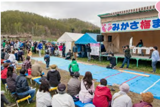
梅干種飛ばし大会