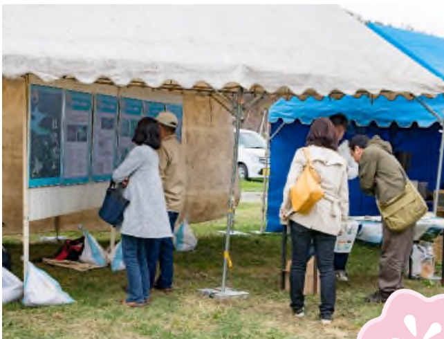
桂沢ダム紹介コーナー