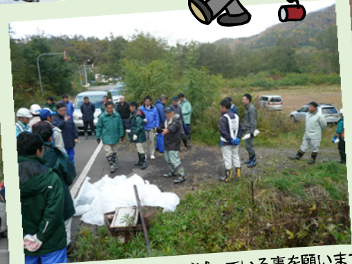
来年は今年よりもゴミが減っている事を願います