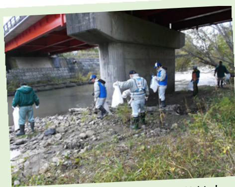
橋の下には多くのゴミが見つかりました

会場のひとつである新幾春別橋周辺(三笠市幾春別錦町)には幾春別連合町内会、(株)エスケー興業、三笠市役所、岩見沢河川事務所、幾春別川ダム建設事業所から約30名(うち、幾春別川ダム建設事業所から10名)が参加しました。