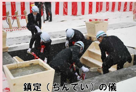
鎮定（ちんてい）の儀