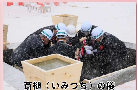
斎槌（いみつち）の儀