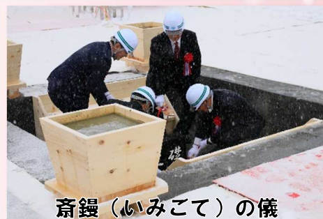
斎饗（いみこて）の儀