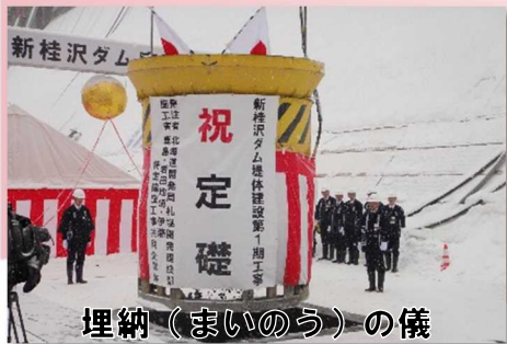
埋納（まいのう）の儀