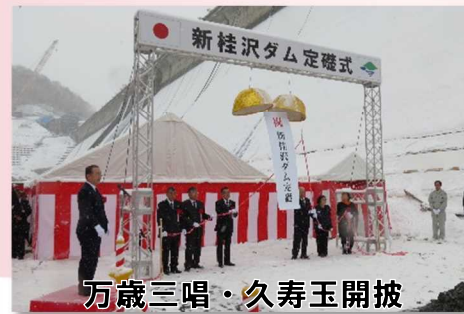
万歳三唱・久寿玉開披