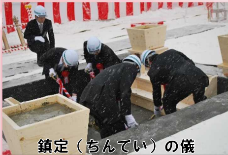
鎮定（ちんてい）の儀

新桂沢ダムは平成2年度から建設に着手し、平成27年度より基礎掘削、平成28年度に堤体建設工事の契約を経て、平成29年7月3日よりコンクリート打設を開始し、現在、鋭意工事を進めているところ。今後も職員一丸となって、地域の文化、自然環境への配慮、品質確保及び安全に万全を尽くし、地域の皆様の期待に応えられるよう努力する所存。