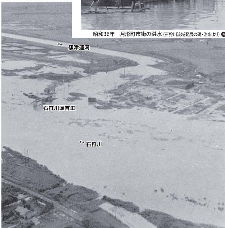
昭和36年 月形町 石狩川頭首工付近 ⑤