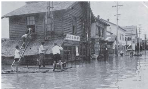
昭和36年 月形町市街の洪水 (石狩川流域発展の礎・治水より) ④