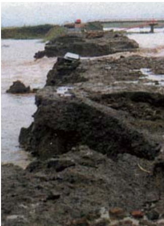
産化美唄川17号線橋付近 ①

北村では幾春別川、旧美唄川の流域で家屋の浸水953棟、農作物被害5,597haと過去最高の被害を記録しました。