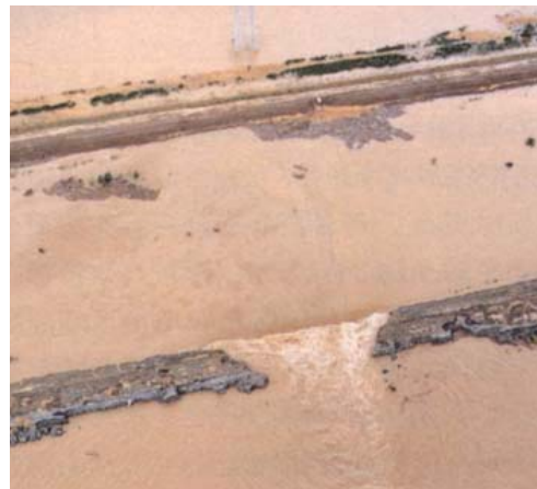
産化美唄川17号線橋上流 ②