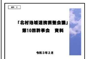
北村地域連携調整会議「第10回幹事会」配付資料